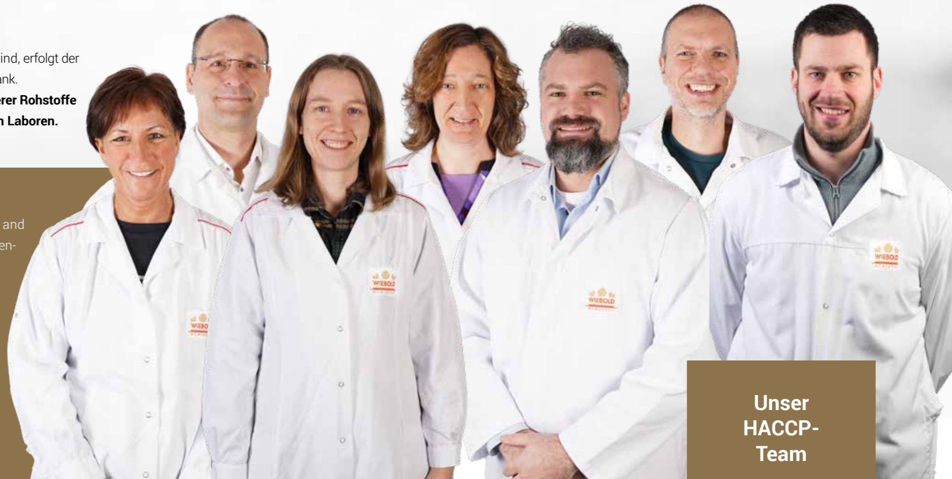
Unser HACCP- Team

HACCP bedeutet „Hazard Analysis and Critical Control Points“ bzw. „Gefahrenanalyse und Festlegung kritischer Lenkungspunkte“. Wir haben ein HACCP-System aufgebaut, um die Risiken und Gefahren, die sich gesundheitsschädlich auf die Endverbraucher*innen auswirken können, zu beherrschen. Unser HACCP-System ist nach den 12 Stufen und 7 Grundsätzen des Codex Alimentarius aufgebaut.